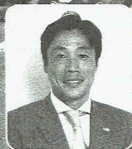
ゲストランナー 鈴木尚広 選手 (元読売巨人軍)